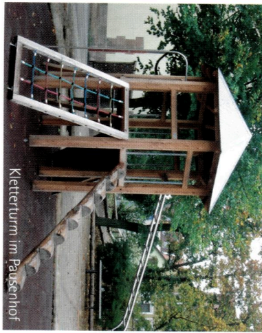
Kletterturm im Pausenhof

Der Förderverein der Luitpoldschule Schwabach wurde im Mai 2008 gegründet, um die Schule und deren Schüler in materieller und ideeller Hinsicht zu unterstützen und damit einen Beitrag zu leisten, die Chancen unserer Kinder zu verbessern.