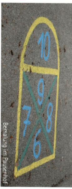
Bemalung im Pausenhof

Satzungsgemäß vorgesehen ist die Förderung von Bildung und Erziehung durch die ideale und materielle Förderung der pädagogischen Arbeit sowie finanzielle Unterstützung von kulturellen Veranstaltungen, Schulfesten, Ausflügen, Schulfahrten, Lehr- und Lernmitteln und sonstiger Ausrüstung der Schule, soweit öffentliche Mittel nicht oder nicht ausreichend zur Verfügung stehen. In Einzelfällen können auch Schülerinnen und Schüler unterstützt werden, die andernfalls nicht an Klassenfahrten oder Schulveranstaltungen teilnehmen könnten.